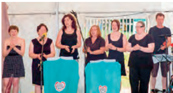
Aus dem Archiv: Gospelchor beim Mondputzerfest