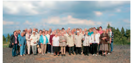
Im Bild: Ausfahrt nach Gottesgab 2014

Am 10. Mai plant der Erzgebirgszweigverein und unsere Kirchgemeinden einen Ausflug im Reisebus nach Großolbersdorf mit Mittagessen in der Heinzebank und dem Besuch des Zschopauer Schlosses. Start: 9:00 Uhr, Rückkehr: 18:00 Uhr. Kosten ohne Mittagessen: 30 €. Damit wir planen können, bitten wir um verbindliche Anmeldung bis zum 7. April in unseren Pfarrämtern. Bitte haben Sie Verständnis, dass die Fahrt aus Kostengründen nicht stattfinden kann, wenn sich bis dahin weniger als 30 Personen anmelden.