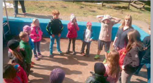
Kinderrüstzeit in Schmalzgrube Frühjahr 2015

Bläsertreffen zum 25. Tag der Deutschen Einheit in Jöhstadt mit Gästen aus, Middels, Velden und Grumbach