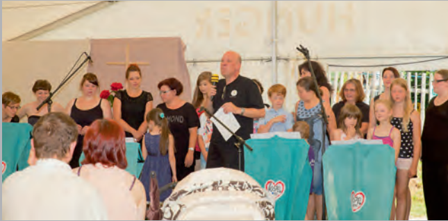
Der Gospelchor mit Kurrende beim Mondputzerfest Grumbach