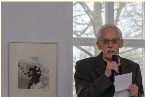
Eröffnung der aktuellen Ausstellung in der Galerie im Pfarrhaus