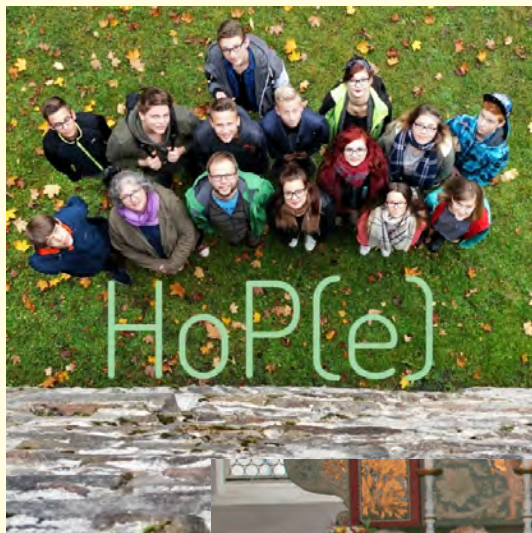
Erstes Hope-Wochenende in Schmalzgrube