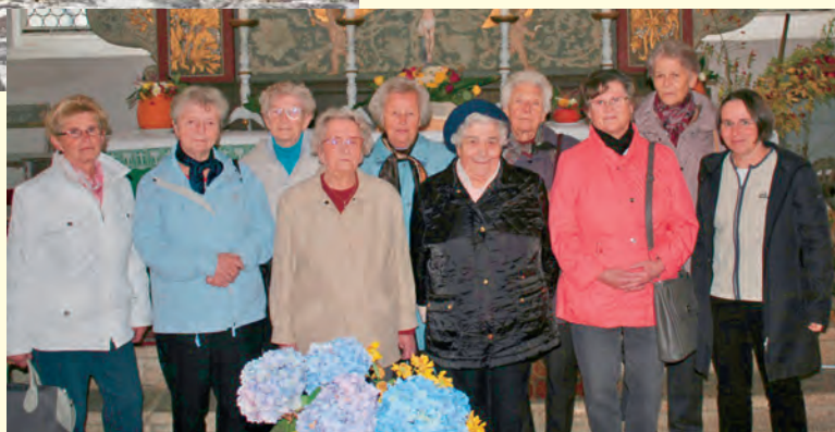
Ausflug des Älterenkreises nach Schwarzenberg