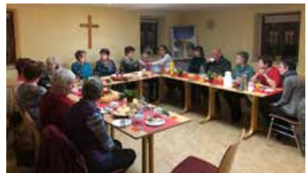
Weihnachtsfeier vom Kirchenchor